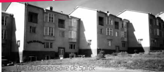
Vue du dispensaire de Spitak

Le projet de fournir des soins médicaux et gratuits aux enfants, décidé conjointement par "Espoir pour l'Arménie" et l'UMAF en 1998 et concrétisé en 2001, a été mené à bien : les enfants viennent volontairement ou sont envoyés par la Mairie de Spitak.