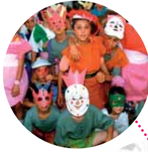
SPITAK Centre aéré et Centre pédiatrique