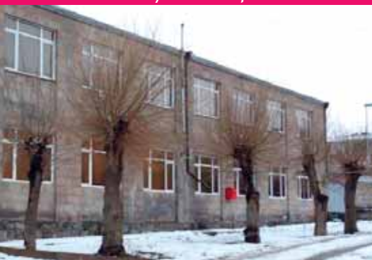
2018 - Centre Culturel de Sissian