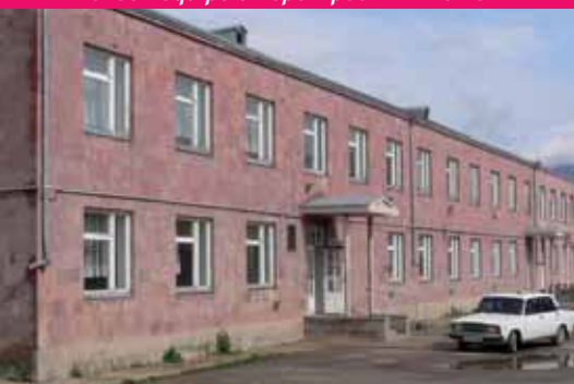
1999 - École Daniel Sahagian