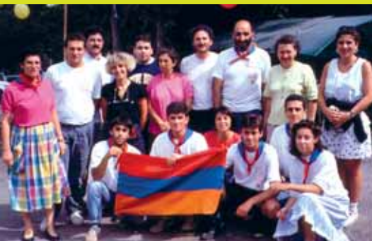
1990 - Première colonie en Arménie avec l'équipe d'Espoir pour l'Arménie