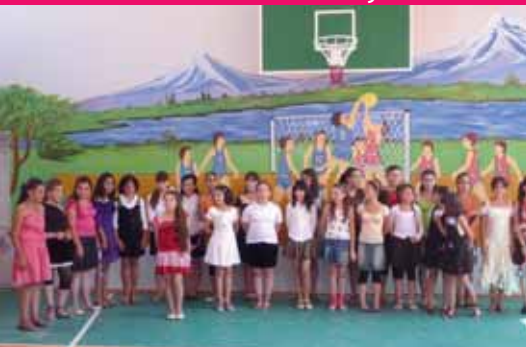
2011 - Gymnase de Spitak