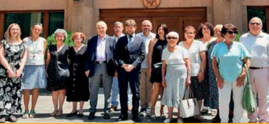
Le groupe touristique et humanitaire reçu à l'Ambassade de France en Arménie