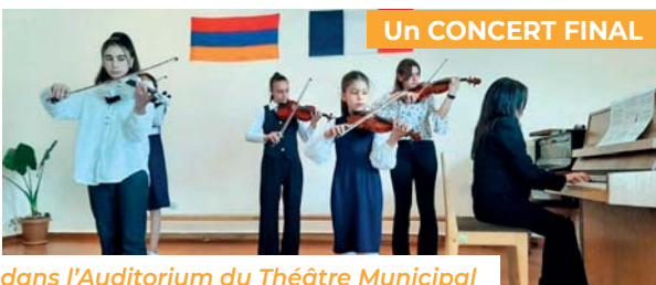
Un CONCERT FINAL