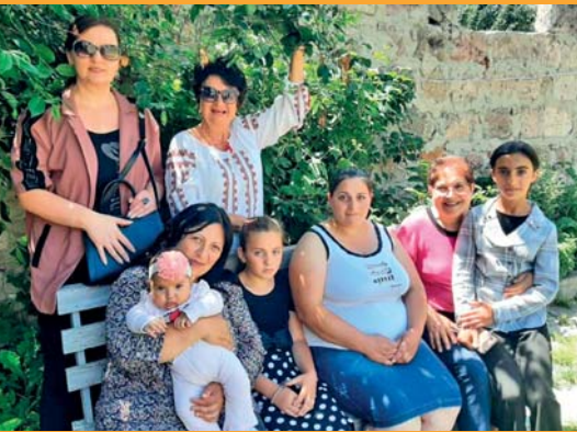
Visite d'une famille parrainée à Sissian