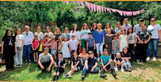
Les enfants parrainés avec l'équipe du container