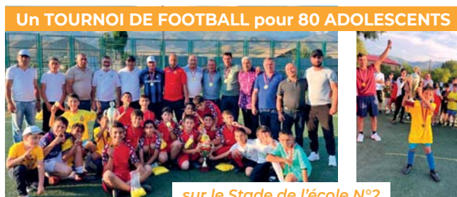
Un TOURNOI DE FOOTBALL pour 80 ADOLESCENTS