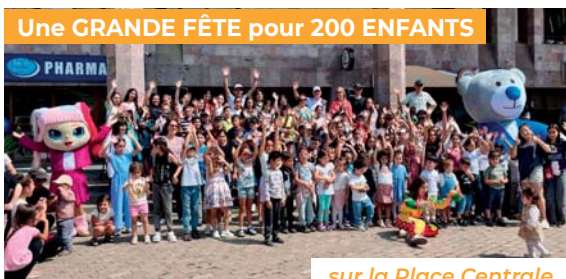
Une GRANDE FÊTE pour 200 ENFANTS

QUATRE TEMPS FORTS ONT PONCTUÉ CES JOURNÉES FESTIVES.